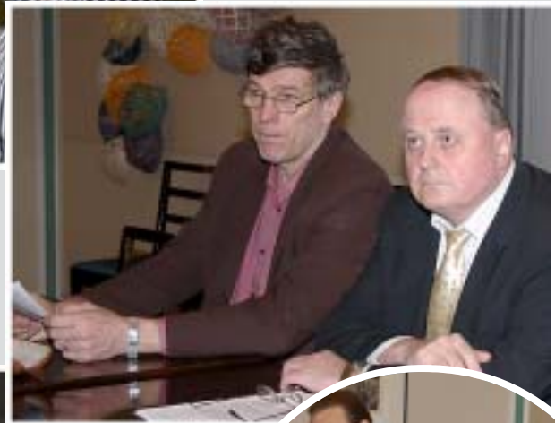
Komennusmiesten lähetystö tapasi eduskunnassa Keskustan, Vasemmistoliiton, SDP:n ja Kokoomuk- sen edustajat