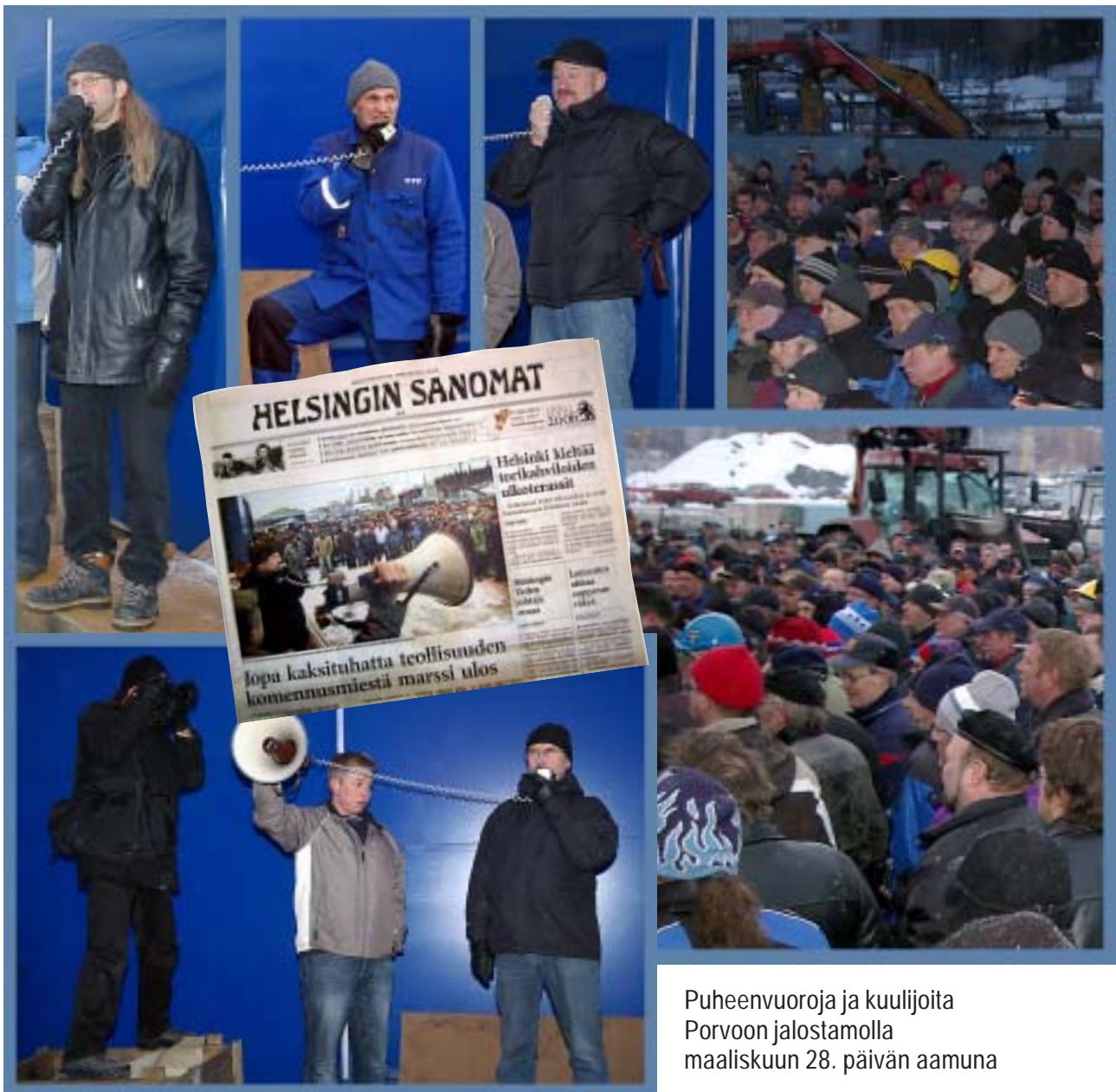
Puheenvuoroja ja kuulijoita Porvoon jalostamolla maaliskuun 28. päivän aamuna

Porvoon jalostamolla tiistai-aamuna 28.3 pidetty kokous teki omalta osaltaan päätöksen lähteä koko loppuviikon kestäväan mielenilmaukseen. Pernon ja Rauman telakat pitivät omat kokouksensa puolilta päivin ja tekivät saman päätöksen. Tämän jälkeen mukaan liittyi useita työpaikkoja ympäri Suomea eri pituisin työnseisauksin. Ainakin Porvoossa mukaan liittyi myös työmaatoimihenkilöitä. Heidän tilanteensa kun on kulukorvausten verotuksen suhteen aivan samanlainen kuin työntekijöiden.